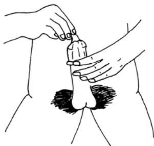
3. ВЫДАВИТЬ ВОЗДУХ ИЗ КОНЧИКА ПРЕЗЕРВАТИВА.