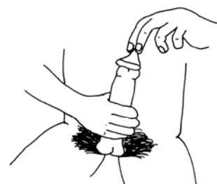
2. НАДЕВАТЬ ТОЛЬКО ПРИ ЭРЕКЦИИ.