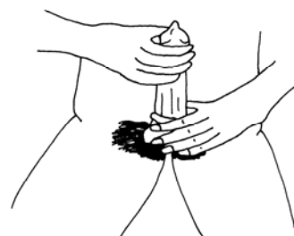
4. РАСПРАВЛЯТЬ ПРЕЗЕРВАТИВ ДО ОСНОВАНИЯ ЧЛЕНА.