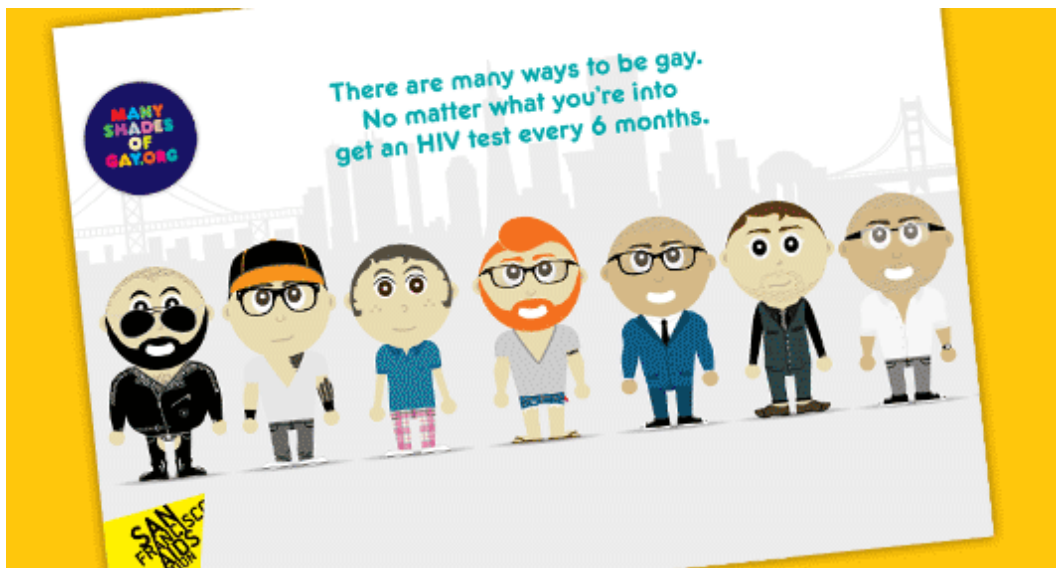
Image de la campagne de dépistage du VIH, Many Shades of Gay de la Fondation pour le SIDA de San Francisco.

La différence entre les taux de dépistage explique pourquoi les diagnostics de VIH sont en baisse à San Francisco mais ne diminuent pas à Londres, a montré une étude comparative des deux villes. Les résultats sont probablement pertinents pour les communautés gays de beaucoup d'autres grandes villes